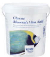
Tropic Marin® Classic Sea Salt

se všemi hlavními, vedlejšími a stopovými prvky přírodní mořské vody