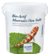
Tropic Marin® Bio-Actif Sea Salt