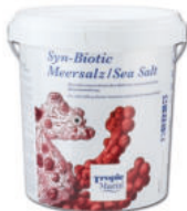
Tropic Marin® Syn-Biotic Sea Salt