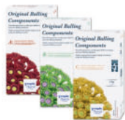
Tropic Marin® Original Balling Components A, B a C prášek, velmi ekonomické