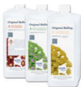
Tropic Marin® Original Balling Liquid Set A, B a C kapalina, snadné dávkování